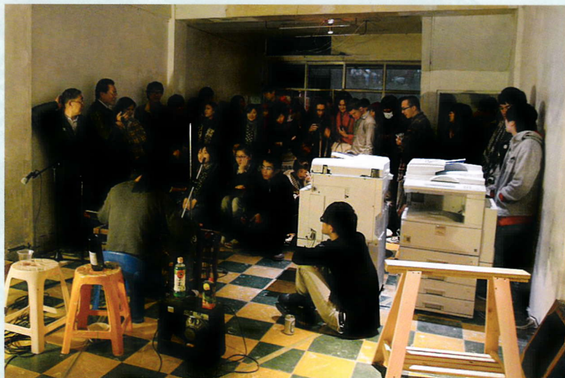
「打開-當代」開幕現場。