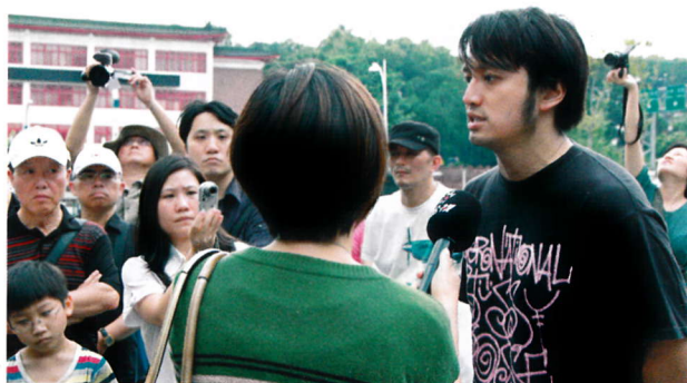
活動發起人於現場接受媒體訪問。