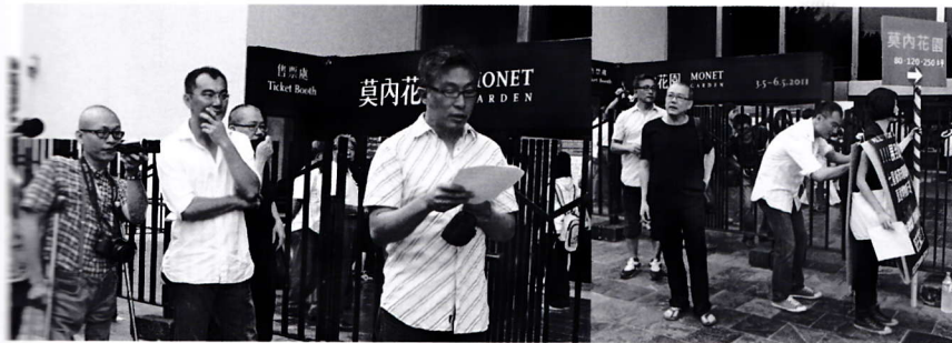
現場藝術家聯署要求相關單位調查。